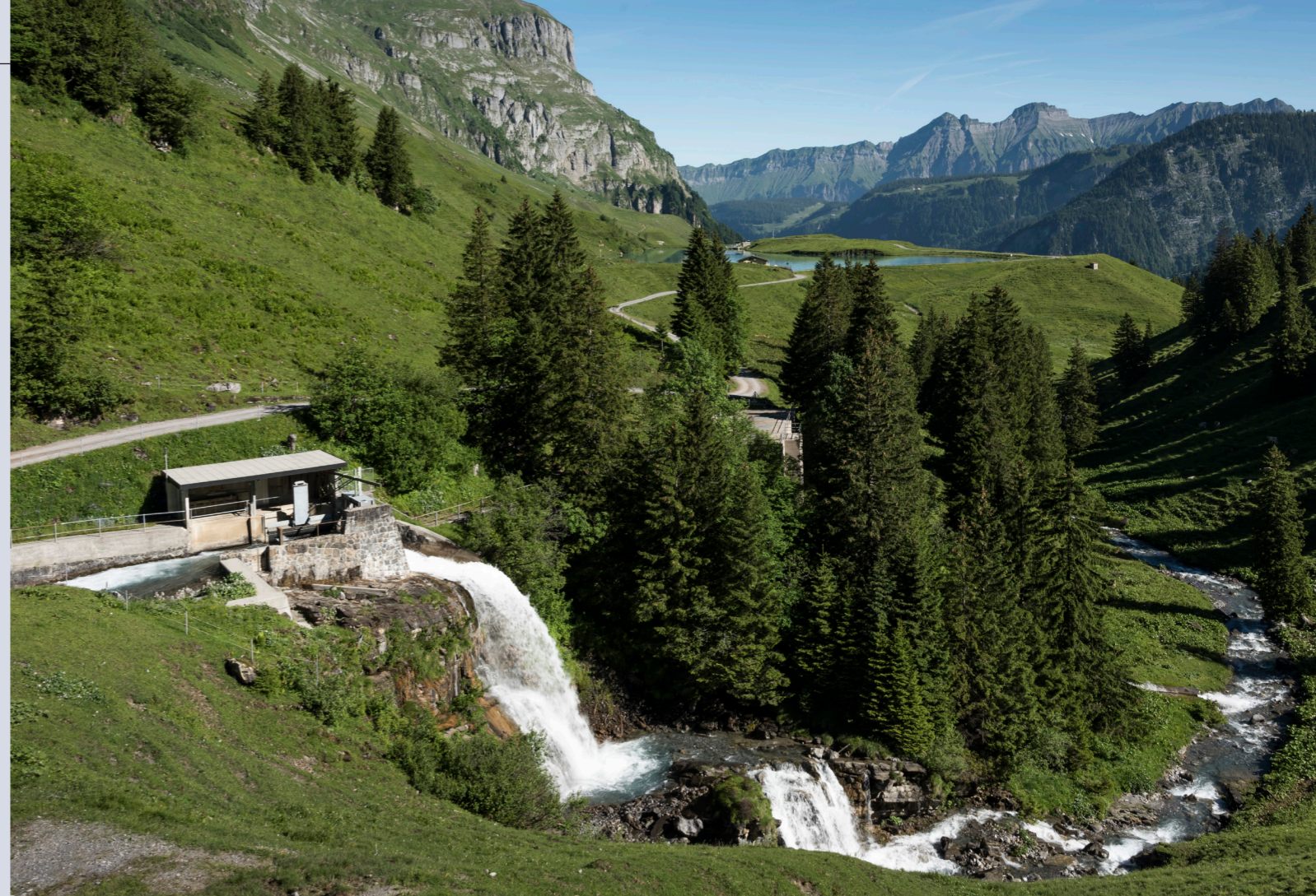
Eine Wasserfassung beim Ruosalper Bach mit dem Ausgleichsbecken Ruosalp im Hintergrund, in idyllischer Kulisse zuhinterst im Muotatal.

Wird Energie direkt dort produziert, wo sie auch genutzt wird, können viele Ressourcen gespart werden. Es sind keine zusätzlichen Infrastrukturen erforderlich und der Strom legt kürzere Strecken zurück, wodurch Transportverluste und zusätzliche Energieaufwände minimiert werden.