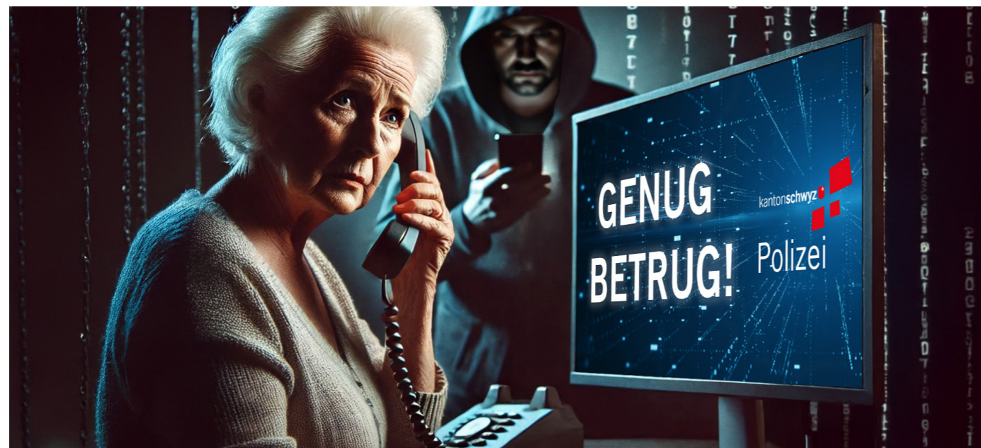
Bild unten: Die Sensibilisierung der Bevölkerung ist für die Kantonspolizei Schwyz ein zentrales Element.

Denial of Service (DoS): Damit wird ein System durch eine Überhäufung von Anfragen lahmgelegt. Dadurch ist das System nicht mehr erreichbar und kann der Täterschaft den Weg ebnen, um vom eigentlichen Angriff auf ein System abzulenken. Ein DDoS-Angriff richtet sich ausschliesslich gegen die Verfügbarkeit eines Systems und führt nicht zum Abfluss von Daten.