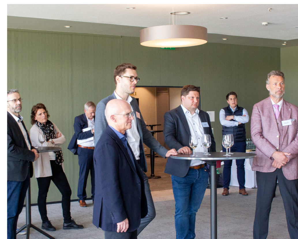
Im Anschluss gab es im Plenum eine kurze Zusammenfassung von allen drei Experten.